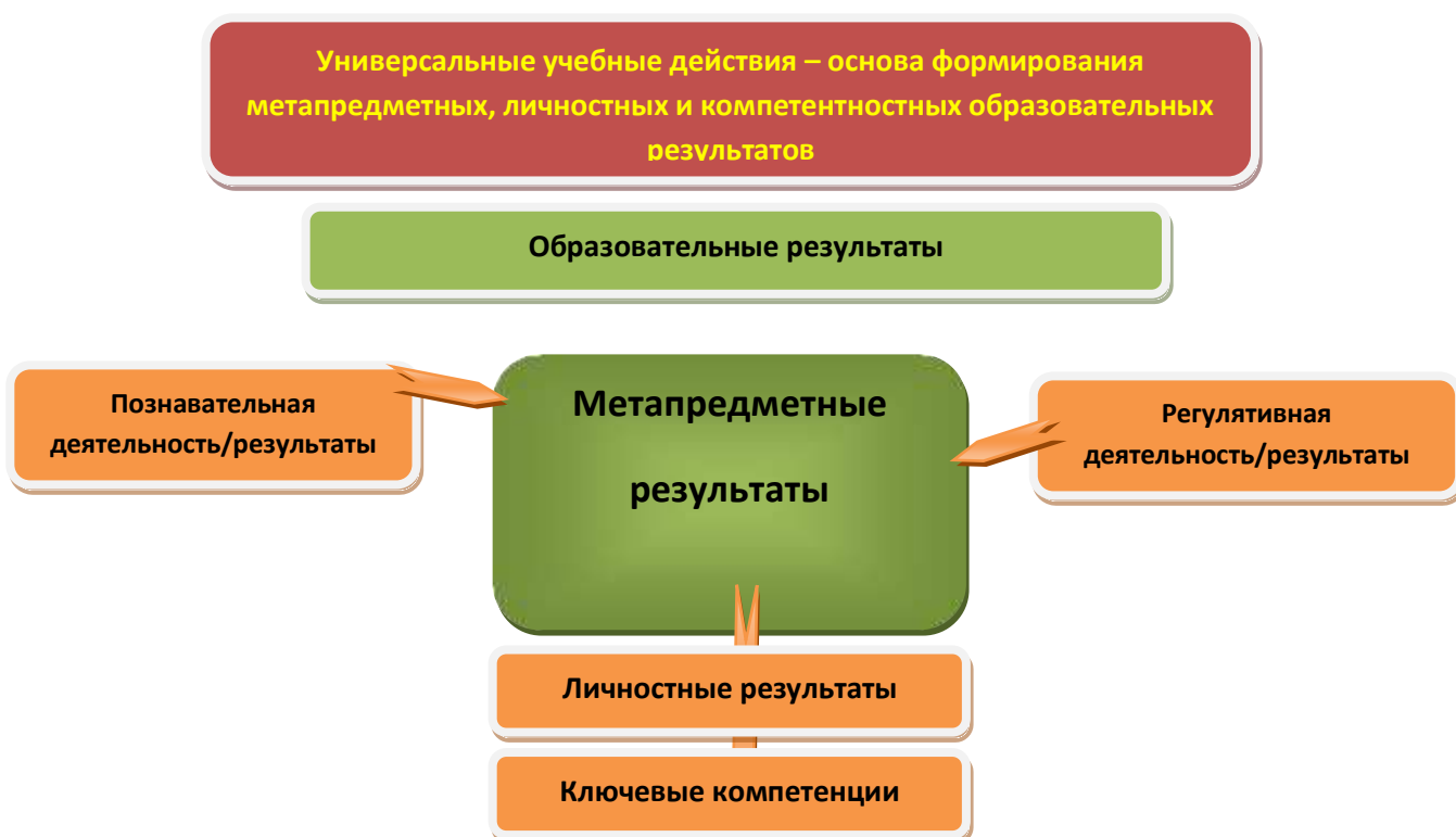
Рис. 3. Система оценки образовательных результатов

Интерпретация результатов оценки ведётся на основе контекстной информации об условиях и особенностях деятельности субъектов образовательного процесса. В частности, итоговая оценка обучающихся определяется с учётом их стартового уровня и динамики образовательных достижений