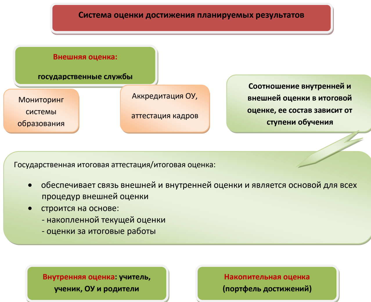
Рис. 2. Система оценки достижения планируемых результатов

Полученные данные используются для оценки состояния и тенденций развития системы образования (рис. 2).