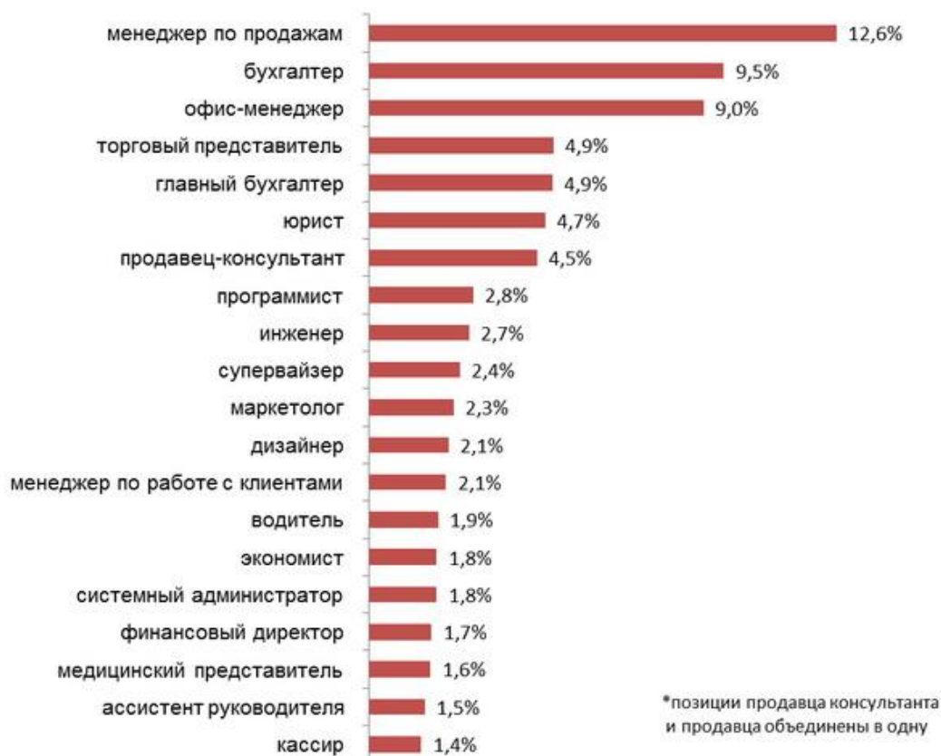
Рейтинг топ-20 запросов работодателей в Казахстане, 1 полугодие 2013 г. (в % от общего количества запросов)