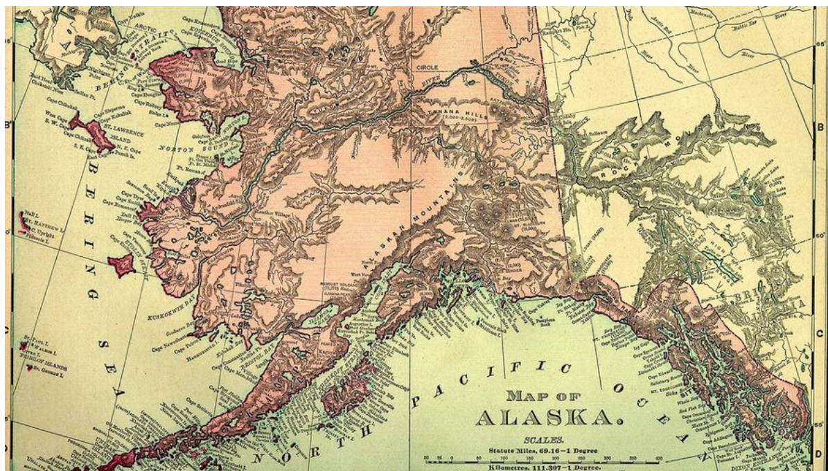
Рисунок 2. Изучение культурных последствий продажи Аляски

Продажа Аляски в 1867 году оказала значительное влияние на Россию, приведя к серьезным экономическим потерям, включая ущерб в судоходстве. Согласно заявлению Самойленко, экономические последствия этого события были ощутимы, особенно в области судоходства [4]. Последствия продажи Аляски для русской культуры также оказались значительными, особенно в контексте влияния на жизнь коренного населения этой территории [15].