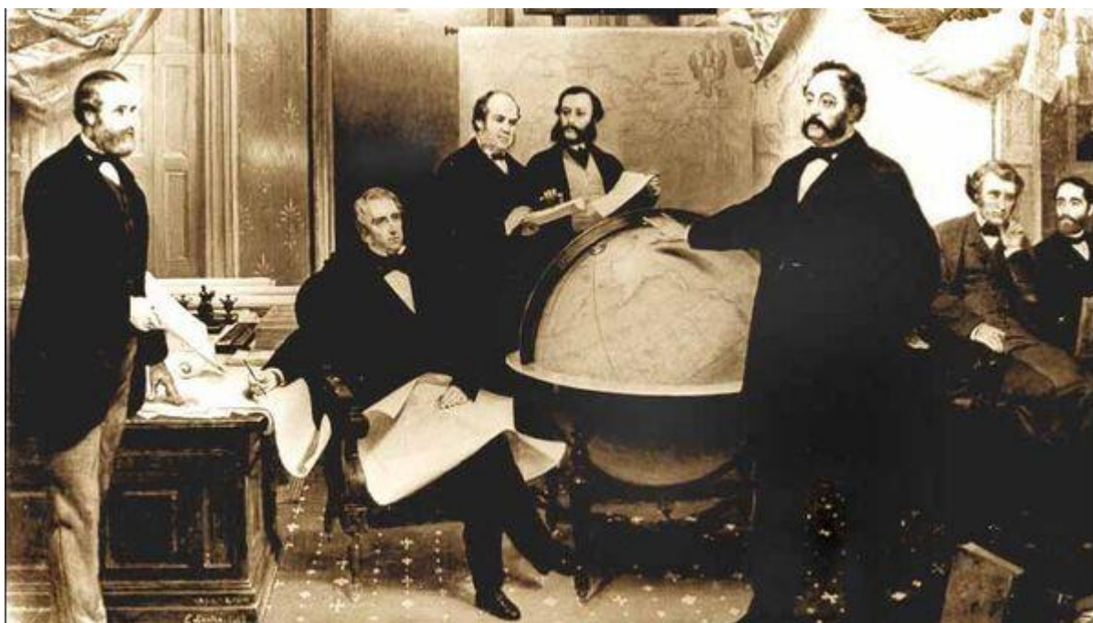
Рисунок 4. Исторический контекст продажи Аляски и его значение для современности

Продажа Аляски в 1867 году стала одним из ключевых событий в истории Российской империи, оставив значительный след в историческом контексте. Эта сделка между Российской империей и Соединенными Штатами Америки вызывает по сей день разнообразные мнения и споры о целесообразности такого поступка со стороны России [22].