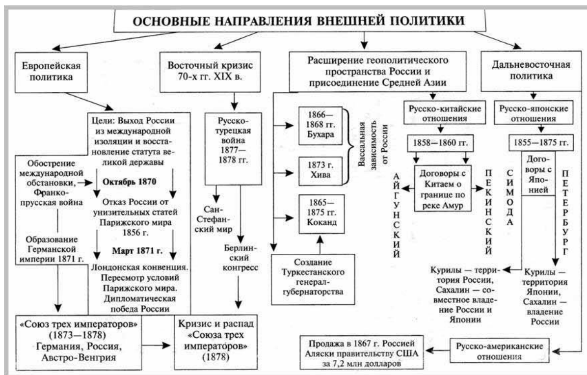
Рисунок 1. Влияние продажи Аляски на внешнюю политику России

Продажа Аляски в 1867 году оказала значительное влияние на внешнюю политику России и ее позицию на мировой арене. Исследования показывают, что этот исторический акт имел долгосрочные последствия для страны, включая изменения в стратегии внешней политики и восприятии России другими государствами.